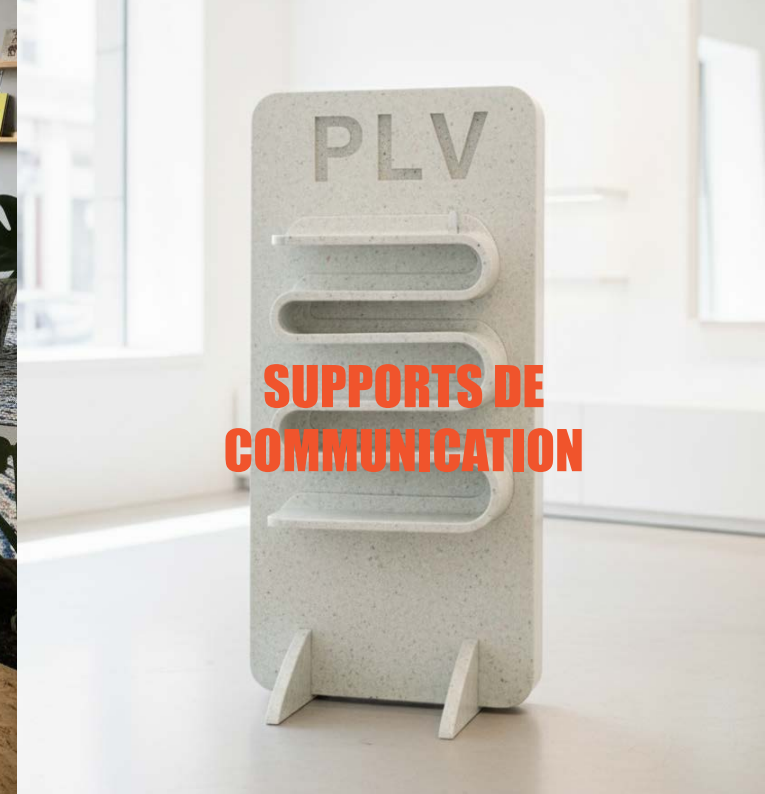
SUPPORTS DE COMMUNICATION